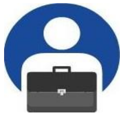
Người mua/ Nhà bán lẻ